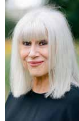
Chers Bryards, Chers Parents,