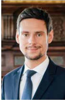
Chères Bryardes, Chers Bryards,

Le Théâtre de Bry-sur-Marne ouvre une nouvelle fois ses portes pour vous proposer une programmation éclectique, émouvante, drôle et passionnante.